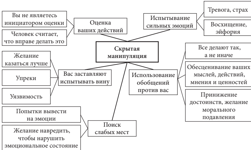
Рис. 2. Интеллект-карта.

Автор — студент группы ИБ-21-1 Святослав Ваткин